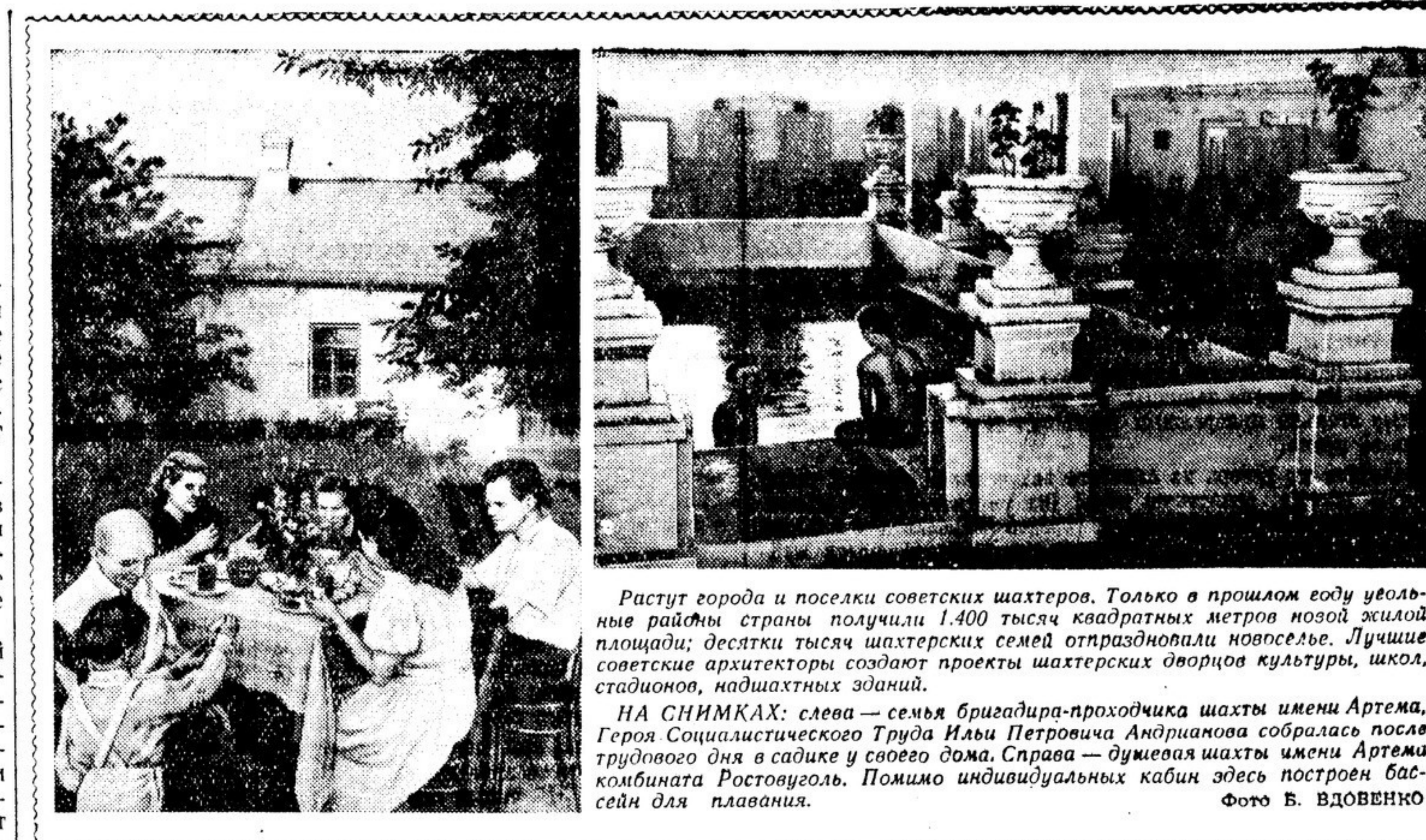
Растут города и поселки советских шахтеров. Только в прошлом году увеличены районы страны получили 1.400 тысяч квадратных метров новой жилой площади; десятки тысяч шахтерских семей отразновились новоселье. Лучшие советские архитекторы создают проекты шахтерских дворцов культуры, школ, стадионов, жилищных зданий.

Иногда такие предложения принимались писателями. Поэтому приходится говорить о взаимном несерьезном подходе. Понимаю, что кино — важнейшее искусство, нельзя рассуждать так, что мол, «в моем личном творческом плане главное — работа над повестью, повестью или повестями».