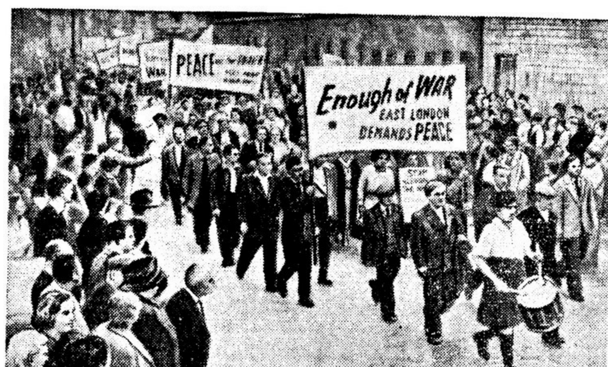
Народы борются за мир. По улицам рабочего района Лондона, Ист-энда, который подвергался во время второй мировой войны безжалостным бомбардировкам гитлеровцев в течение 93 ночей подряд, проходят тысячи демонстрантов. Они протестуют против ремилитаризации Германии. На десятках знамен и плакатов написаны слова: «Довольно войн. Жители Восточного района Лондона требуют мира».

Встречи на первенство мира обычно начинались утром и продолжались весь день и даже вечером, при свете прожекторов. На трибунах всегда было много людей, и среди них не было равнодушных наблюдателей. Мы, участники состязаний, хорошо чувствовали, как реагируют на ход состязаний зрители. Их волнение передавалось и нам, спортсменам. Но, пожалуй, острее все переживали все партии спортивной борьбы свободные от игры волейболисты. На площадке — мужские команды Венгрии и Чехословакии. Это первоклассные мастера. Мы, советские волейболисты, си-